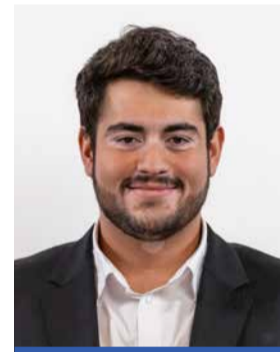
Can Mermer 23, Näfels