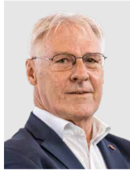
Roland Goethe, Landrat Glarus

Es gibt Vorlagen, bei denen man lange suchen muss, um den roten Faden zu finden. Und es gibt Vorlagen, wie die Massnahme D im Entlastungspaket 2025+, bei denen es klar ist: Fairness, Verantwortung und gesunder Menschenverstand.