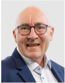
Albert Heer, Landrat Glarus Nord

Angesichts der angespannten finanziellen Lage des Kantons hat der Regierungsrat im Oktober 2024 das Entlastungspaket 2025+ verabschiedet. Dieses umfasst eine Reihe von Massnahmen zur gezielten Stabilisierung des Finanzhaushalts. Bereits beschlossen wurden durch Regierungsrat und Landrat in eigener Kompetenz 54 Einzelmassnahmen mit einem Einsparvolumen von rund 5,7 Millionen Franken. Vier weitere Vorhaben liegen nun zur Entscheidung bei der Landsgemeinde.