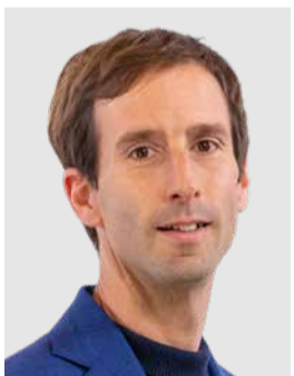
Stephan Muggli, Landrat Glarus Süd

Das vorliegende Geschäft geht zurück auf die Prämienentlastungs-Initiative, welche 2024 vom Stimmvolk abgelehnt wurde. Mit der Ablehnung kam der damit verbundene indirekte Gegenvorschlag zum Zug. Damit verpflichtet der Bund die Kantone, deutlich mehr Geld für die individuelle Prämienverbilligung (IPV) einzusetzen. Für den Kanton Glarus bedeutet das zusätzliche über 8 Millionen Franken pro Jahr, wobei dieser Betrag getrieben durch die zunehmenden Gesundheitskosten weiter steigen wird.